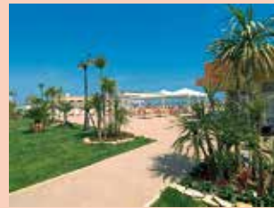
PINARELLA DI CERVIA